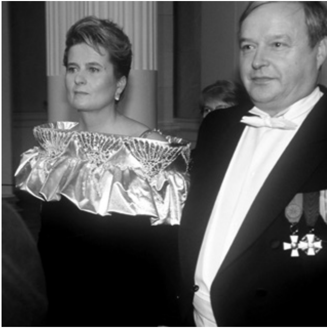
80-luvun kimallusta.