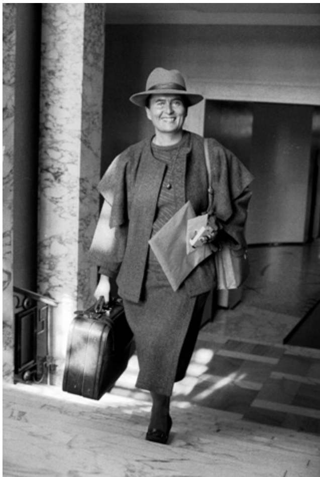
Riitta Uosukainen astelee matkalaukkuineen Eduskuntatalon aulassa tuoreena kansanedustajana 1983. Työ alkaa.