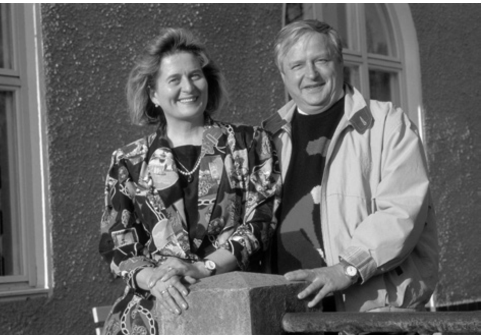
Tässä talossa tarina alkoi vuonna 1961: Imatran Kaksoisyhteislyseo Riitan ja Topin taustana vuonna 1991.